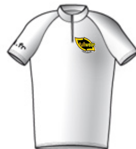
Maillot du Meilleur jeune