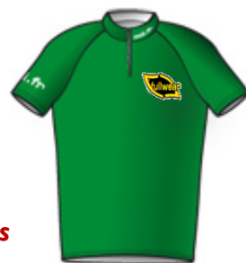
Maillot points chauds