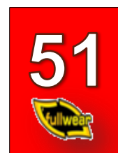
Dossard de la meilleur EQUIPE