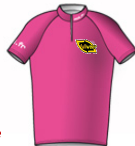
Maillot de Leader Fille