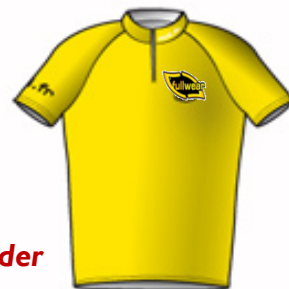
Maillot de Leader