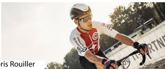
Loris Rouiller © schlegto

A domicile, les Français ne manqueront pas de jouer