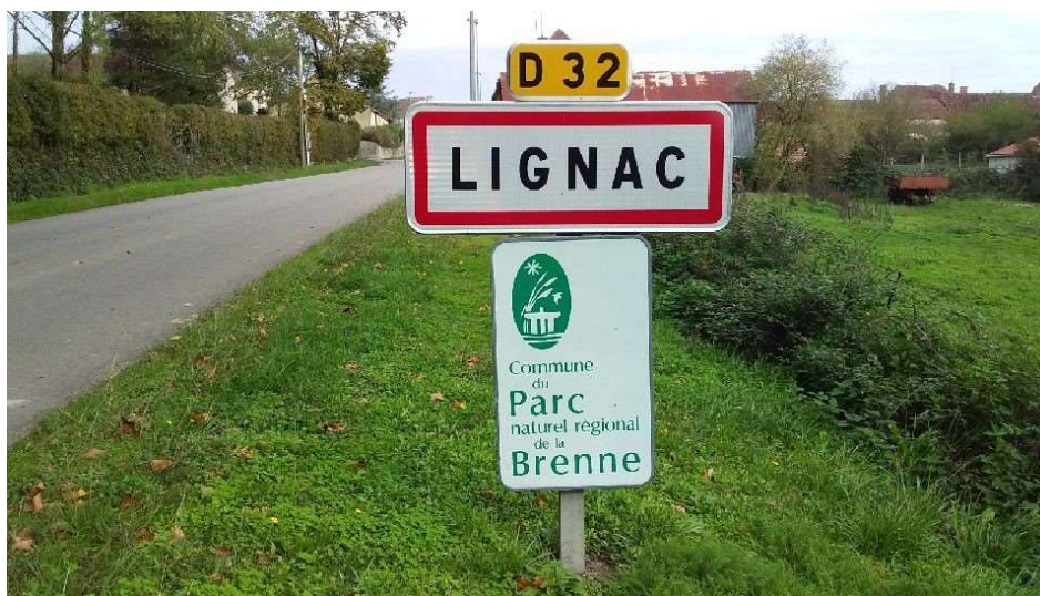
Lignac est située au sud-ouest du département de l'Indre, au sein du Parc naturel régional de la Brenne.

L'U.S. Argenton Cyclisme en assure l'organisation, conjointement avec le COMC (Comité d'Organisation de Manifestations Cyclistes), la municipalité, le comité des fêtes local et le soutien des collectivités territoriales.